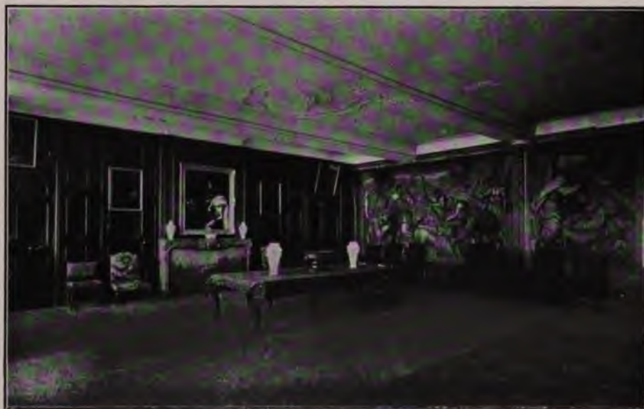
Chambre du Conseil.